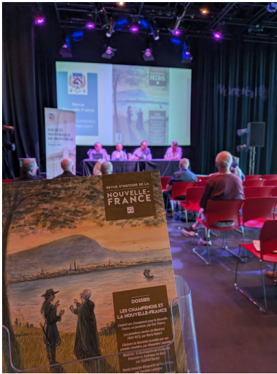
Enregistrement au Cabaret du MEM, 12 septembre 2025

régionaliste gagne du terrain, entraînant la création de nouvelles sociétés, dont celle de Lachine en 1947 (disparue puis réanimée en 1991).