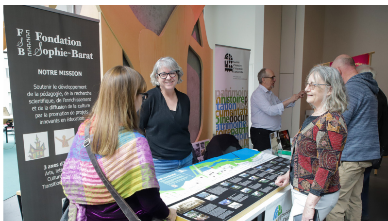
Table de la Société d'histoire d'Ahuntsic-Cartierville, 11 avril 2026

Dans cet écosystème, de tels organismes ont foisonné, surtout depuis les années 1970. Les sociétés d'histoire y jouent aussi un rôle important, parfois ancien, qu'il s'agisse de la préservation du Château Ramezay à la fin du XIXe siècle ou de l'engagement de la Société historique de Montréal pour le Vieux-Montréal au début des années 1960. À mesure que la notion de patrimoine s'est élargie à toutes les époques et à l'ensemble des traces de l'activité humaine, elles ont contribué à le faire vivre dans leurs communautés. Selon un sondage réalisé en 2022, parmi les vingt-quatre sociétés d'histoire du territoire, plus de la moitié ont organisé des activités liées au patrimoine bâti et quatre sur cinq se sont déjà engagées pour défendre un bâtiment ou un site menacé. Ajoutées à leurs nombreuses interventions publiques, ces actions contribuent à créer des milieux de vie vivants et enracinés.