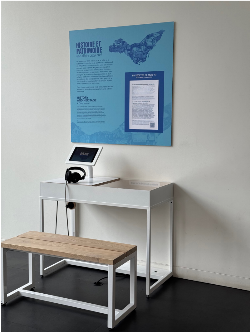
Station de médiation de l'activité en place de septembre 2025 à avril 2026 dans le belvédère du MEM.