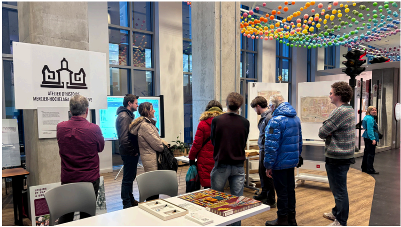
Groupe de visiteurs, 13 décembre 2025

documents, objets et enregistrements, tandis qu'à la Société historique de Rivière-des-Prairies, des fonds de citoyens et de citoyennes du quartier permettent de saisir la vie quotidienne et les transformations du territoire.