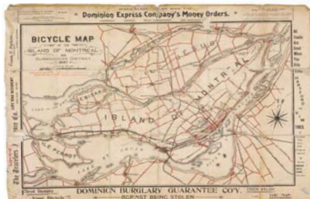
« Bicycle Map of the Island of Montreal and Surrounding District » - 1897, Bibliothèque et Archives nationales du Québec, CA601,5171,551,5552,D2-18-29

Inspirée de la notion d'« espace physique des pratiques sociales » élaborée par le philosophe Henri Lefebvre, l'enquête vise à appréhender la matérialité et la spatialité d'une pratique discrète et souvent invisible tant au sein des archives qu'au sein de l'historiographie : l'usage récréatif et utilitaire de la bicyclette dans un grand centre urbain. Où les cyclistes montréalais font-ils usage de la bicyclette ? Quelles trajectoires empruntent-ils ? Dans quels milieux évoluent-ils ?